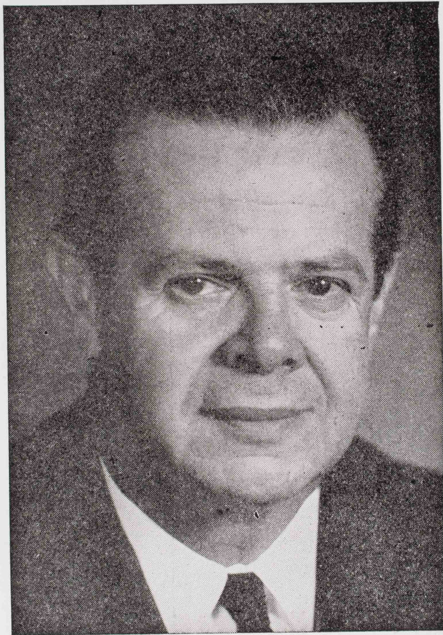
Brigadeiro JOSÉ VICENTE FARIA LIMA DD. Prefeito do Município de São Paulo